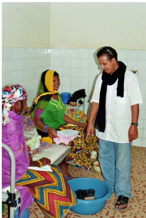
Die junge Mutter und das Kind.

Zu den Grausamkeiten stellte sich bei uns noch eine junge Mutter mit einem einen Monat alten Baby vor, dass multiple Abszesse am ganzen Körper hatte. Das Kind kam bereits am Vorabend, wurde uns jedoch erst am nächsten Morgen vorgestellt. Nachdem 2 Abszesse gespalten wurden, sagte uns die Mutter durch einen Dolmetscher, dass das Kind weiterhin sehr unruhig sei. Ich untersuchte das Kind und entdeckte gleich am Hals und am Ohr rechts einen riesigen Abszess der bis zum Nacken reicht. Außerdem hatte es noch einen riesigen Abszess am Unterarm rechts. Es blieb mir nichts anderes übrig, als die Abszesse zu spalten, das Kind schrie und ich spritzte eine lokale Betäubung, dann öffnete ich einen Abszess um Eiter zu entleeren und es entleert sich sehr viel PUS. Ich spüle die Abszesshöhle aus und tamponiere mit einer Lasche, die ich aus einem sterilen Handschuh herstelle und beginne mit der Mutter zu besprechen, wie sie dem Kind das Antibiotikum geben soll und wie sie es waschen und sauber halten soll. Ausserdem führe ich 2-3-mal täglich einen Verbandswechsel durch.