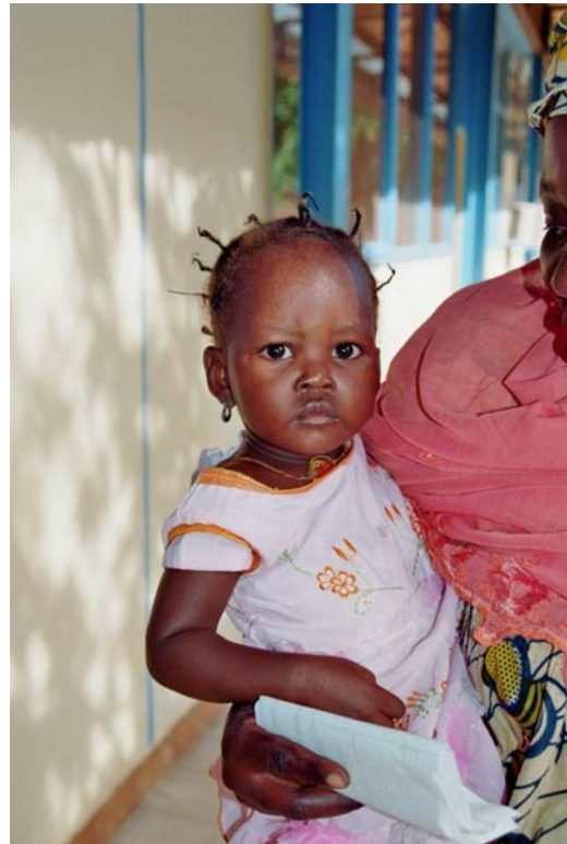
Tee von einem Tuareg und kleines Djarme Mädchen als Patientin