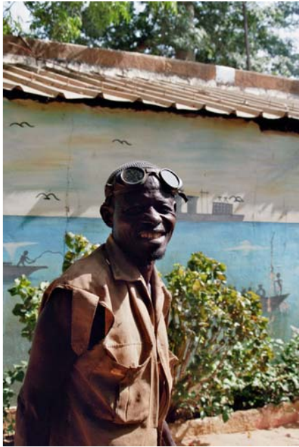
Ein Bewohner von Dosso.

Das ist ein regionales Krankenhaus in der Region Dosso. Diese Region ist vor allem von Djerma-Songhay bewohnt, einer der vielen ethnischen Gruppen im Niger.