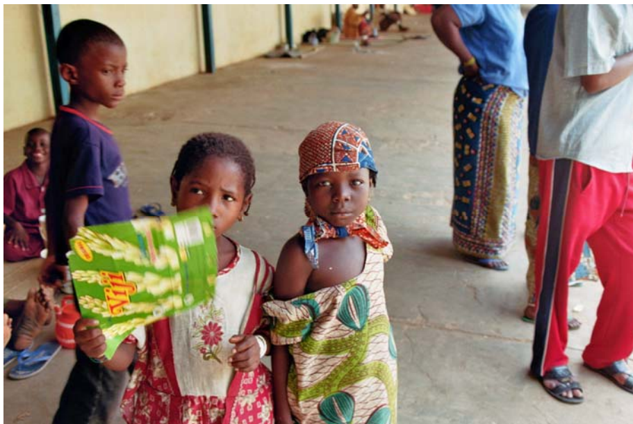
Die anderen Einwohner von Region Dosso.