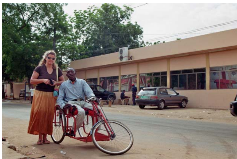
Der stolze Rollstuhlbesitzer

Wir treffen uns nach 2 Stunden wieder. Die Freude ist enorm, als ich die Kosten für den Rollstuhl übernehmen kann. Nun muss er nicht mehr im Sand sitzen und er kann stolz mit dem Rollstuhl herumfahren. Ich versprach ihm, im Januar wieder Rollstühle mitzubringen.