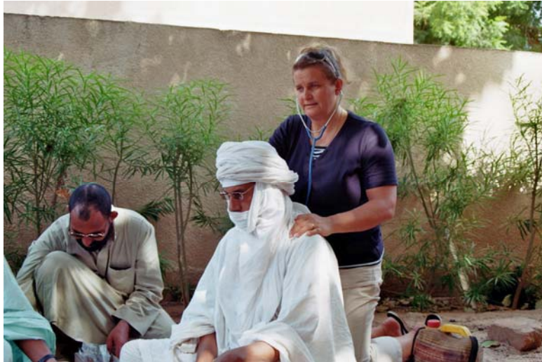
Die Behandlung im Hotel.