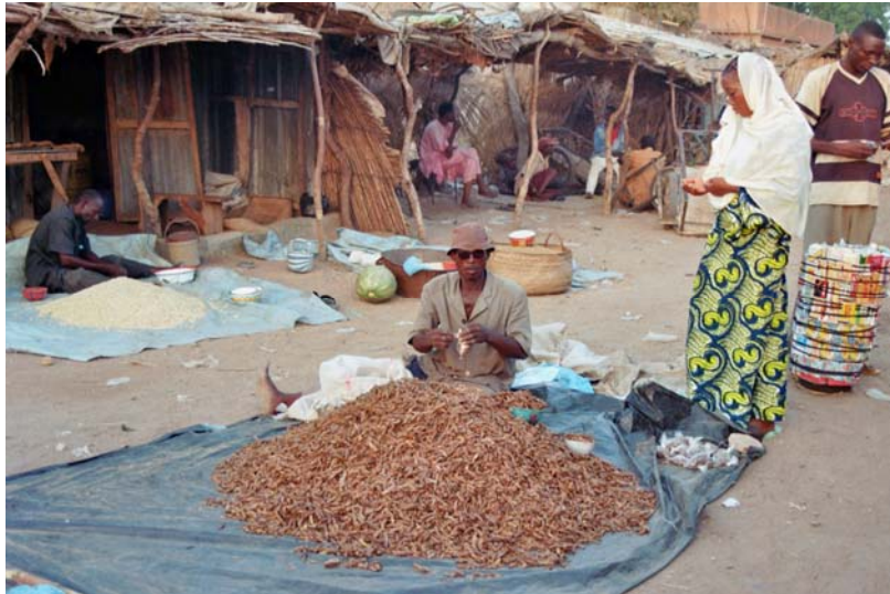
Auf dem Markt mitte im Dosso.

Im Umkreis von Dosso leben etwa 1 Million Einwohner. Dosso selbst hat etwa 80.000 Einwohner. Die Djerma-Songhay leben überwiegend als Ackerbauern.