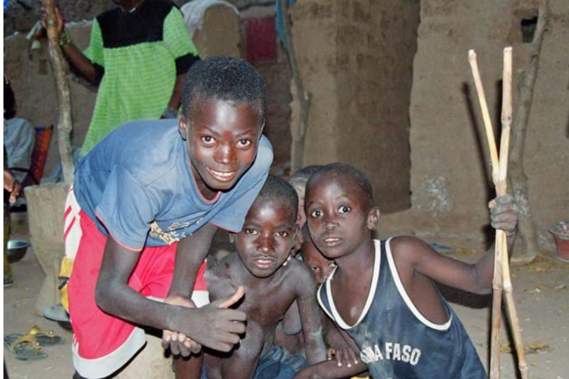
Unsere neugierigen Begleiter

Nach dem wir uns langsam verabschieden wollen, verlangen die Frauen, die uns das Hirse stampfen vorgeführt haben und auch die Frauen die die Töpfe hergestellt haben, nach einer kleinen Bezahlung. Wir bezahlen beide Gruppen und gehen zurück zu unserem Auto. Es ist bereits Samstagabend und wir Essen noch eine Kleinigkeit im Hotel und gehen dann schlafen, um am Sonntag nach Dosso aufzubrechen.