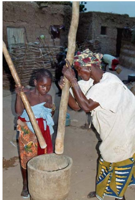
Man versucht zu verkaufen oder gleich Essen vorzubereiten.