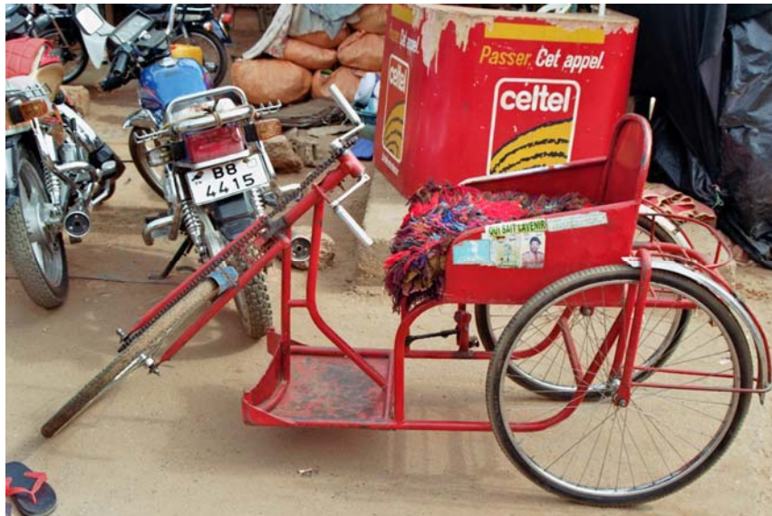
Traum-Rollstuhl für 15 Euro.

Wir treffen uns nach 2 Stunden wieder. Die Freude ist enorm, als ich die Kosten für den Rollstuhl übernehmen kann. Nun muss er nicht mehr im Sand sitzen und er kann stolz mit dem Rollstuhl herumfahren. Ich versprach ihm, im Januar wieder Rollstühle mitzubringen.